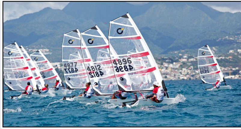
↑他艇種ではわからないスピード感

オープンビックの魅力は、①スピード、②冒険的なコース形態、③海の自然が身近に味わえる！